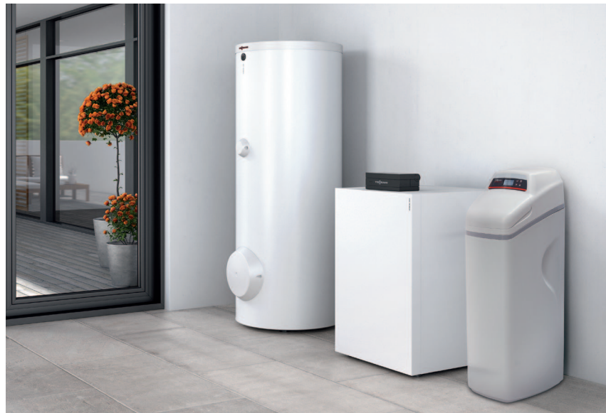
Kamień kotłowy zmniejsza sprawność kotła i procesu grzewczego w instalacjach centralnego ogrzewania i ciepłej wody użytkowej.

Urządzenie dostępne w sprzedaży tylko w sklepie internetowym Viessmann: www.sklep-viessmann.pl